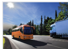
Transport und Verkehr