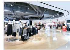
Handel, Franchise, E-Commerce