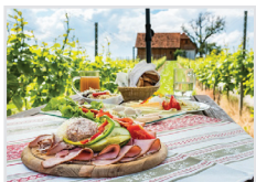
Wein-, Obst-, Garten-, Ackerbau, Tierhaltung