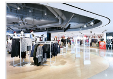
Handel, Franchise, E-Commerce