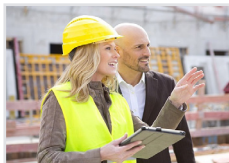
Immobilien, Bau, Baunebengewerbe