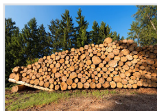
Holzwirtschaft, Erneuerbare Energie, Jagd, Fischerei