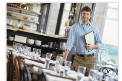
Tourismus, Hotellerie, Gastronomie Tourismus