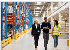
Handwerk, Gewerbe, Industrie