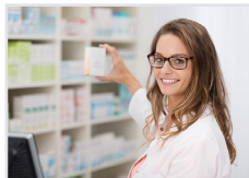
Apotheken, Ärzte, Gesundheitsberufe