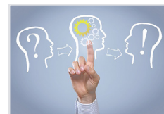
ICT, Entertainment, Kreativwirtschaft