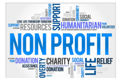
Vereine, Verbände, Körperschaften, NPO