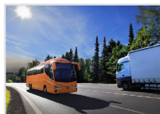
Transport und Verkehr