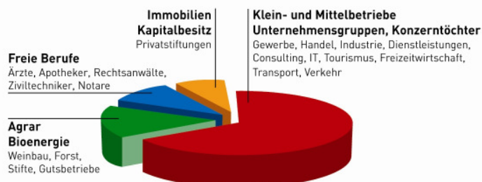
Kundenstruktur, nach Anteilen am LBG-Honorar-Umsatz